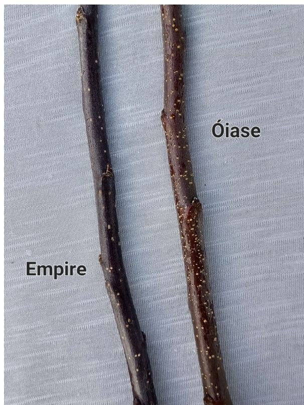
Pommier: 'Óiase' (droite) avec la variété de référence 'Empire' (gauche)

Épreuves et essais: L'épreuve et l'essai comparatifs ont été réalisés sur les terrains du Verger de la Montagne à Mont Saint Grégoire, au Québec. Des pommiers 'Óiase' et 'Empire' ont été greffés sur porte greffe 'Cepiland' (Pajam 2), et 15 pommiers de chaque variété ont été plantés en 2018 sur deux rangs adjacents espacés de 4,5 mètres, avec un espacement de 1,8 mètre sur le rang. Les observations ont été faites sur 10 pommiers ou parties de 10 pommiers de chaque variété.