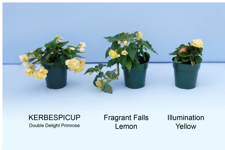
Bégonia: 'KERBESPICUP' (gauche) avec les variétés de référence 'Fragrant Falls Lemon' (centre) et 'Illumination Yellow' (droite)