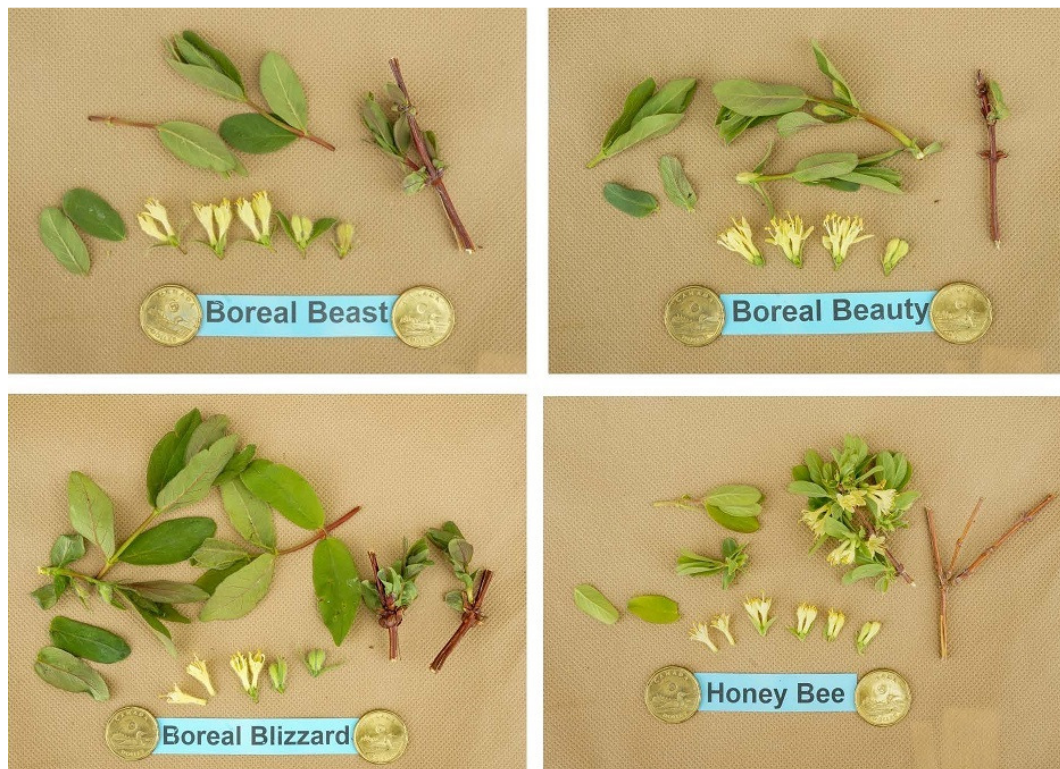
Chèvrefeuille bleu: 'Boreal Beauty' (haut à droite) avec les variétés de référence 'Boreal Blizzard' (bas à gauche) et 'Honey Bee' (bas à droite)