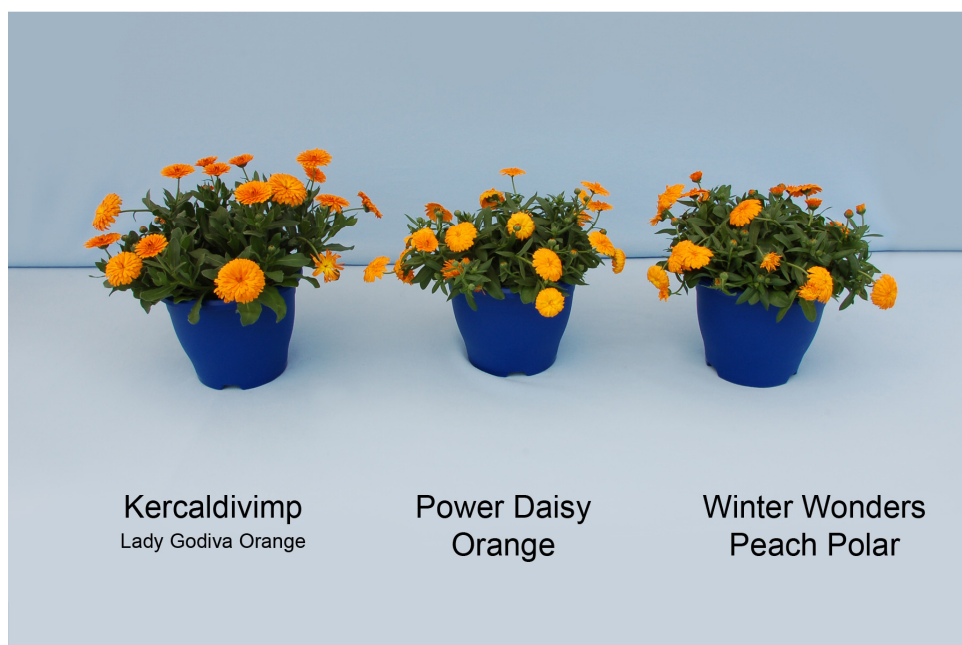
Calendula: 'Kercaldivimp' (gauche) avec les variétés de référence 'Power Daisy Orange' (centre) et 'Winter Wonders Peach Polar' (droite)