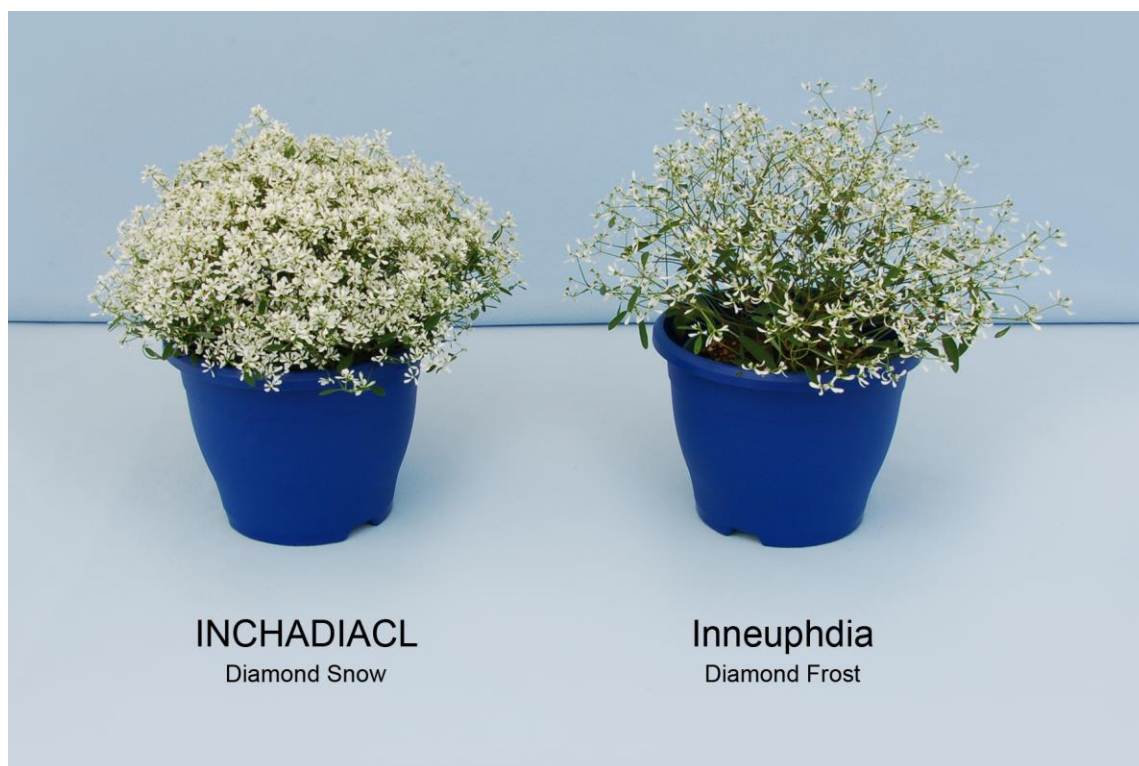
Euphorbe: 'INCHADIACL' (gauche) avec la variété de référence 'Inneuphdia' (droite)