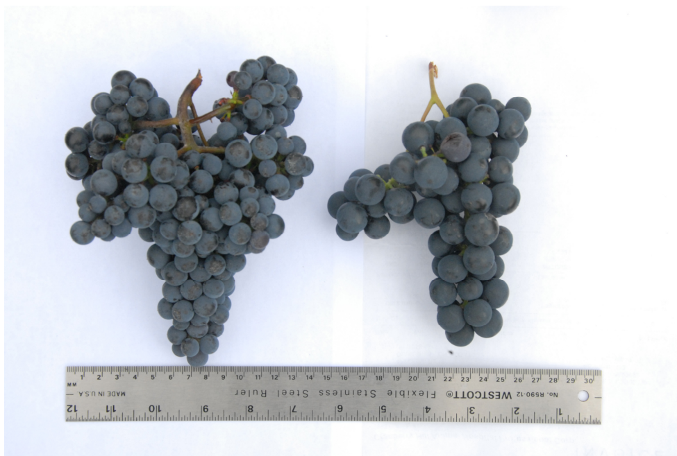
Vigne: 'TP 1-1-12' (gauche) avec la variété de référence 'Crimson Pearl' (droite)