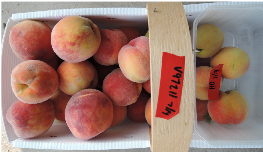
Pêcher: 'V97211' (gauche) avec la variété de référence 'Harrow Diamond' (droite)