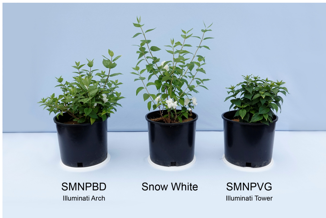
Seringat des jardins: 'SMNPBD' (gauche) avec les variétés de référence 'Snow White' (centre) et 'SMNPVG' (droite)